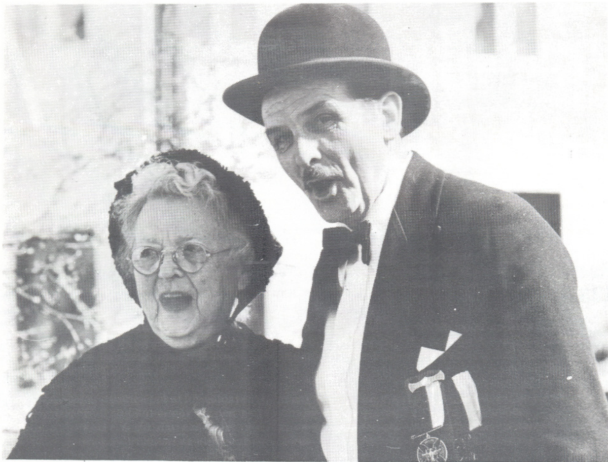
Møtes vi igjen 24. mai på Sandvikstorget?