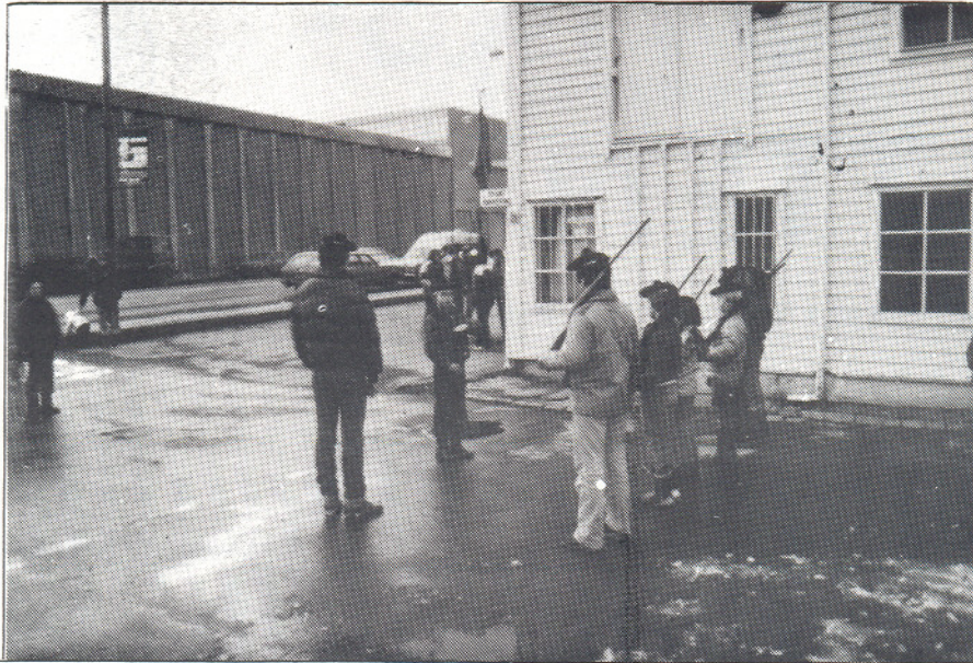
1. komp. sjefen instruerer sine gutter.