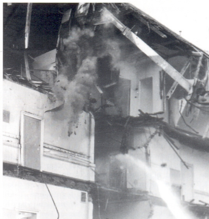
8. mars 1989. «Pinaren» blir knust til pinneved. Kanskje noen av leserne fryder seg over synet?