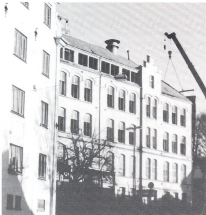
8. mars 1989. Skolen rives. Bare fasaden mot vest står trassig tilbake.