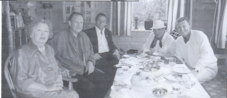
..... og etterpå ble det kaker og kaffi til gjestene i hytten på Trollhaugen.