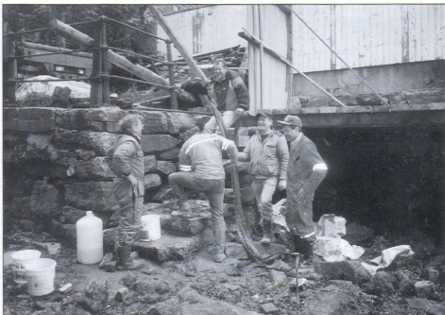
Arbeidsgjengen fra Bergestøen.

Vi leitet overalt, i fjæren på flygaren, men vi fant ingen stein som passet. Etter flere måneders leiting fant vi en stein i Grønneviksøren, den passet nesten, den var litt for lang.