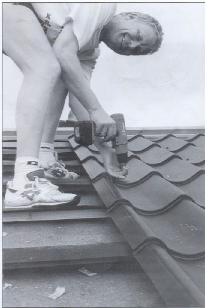
Slik skal det gjøres