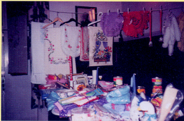
Ett representativt utvalg med gevcisnter fra Damegardens årlige utlodning