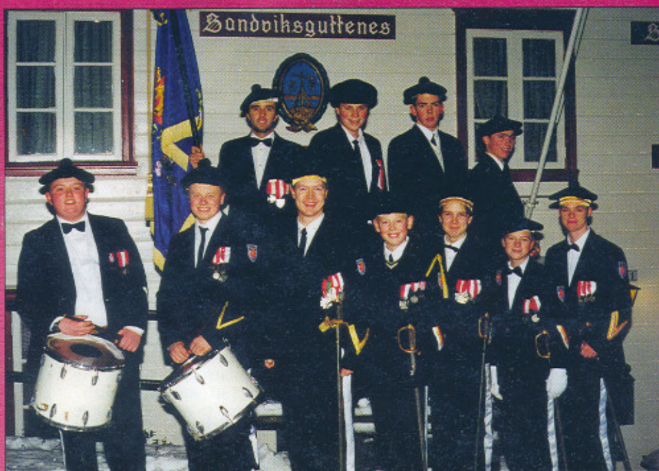
Offiserene i år 2000.