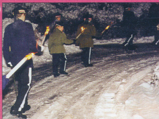
Fakkeltog i Sandviken 19.12.99