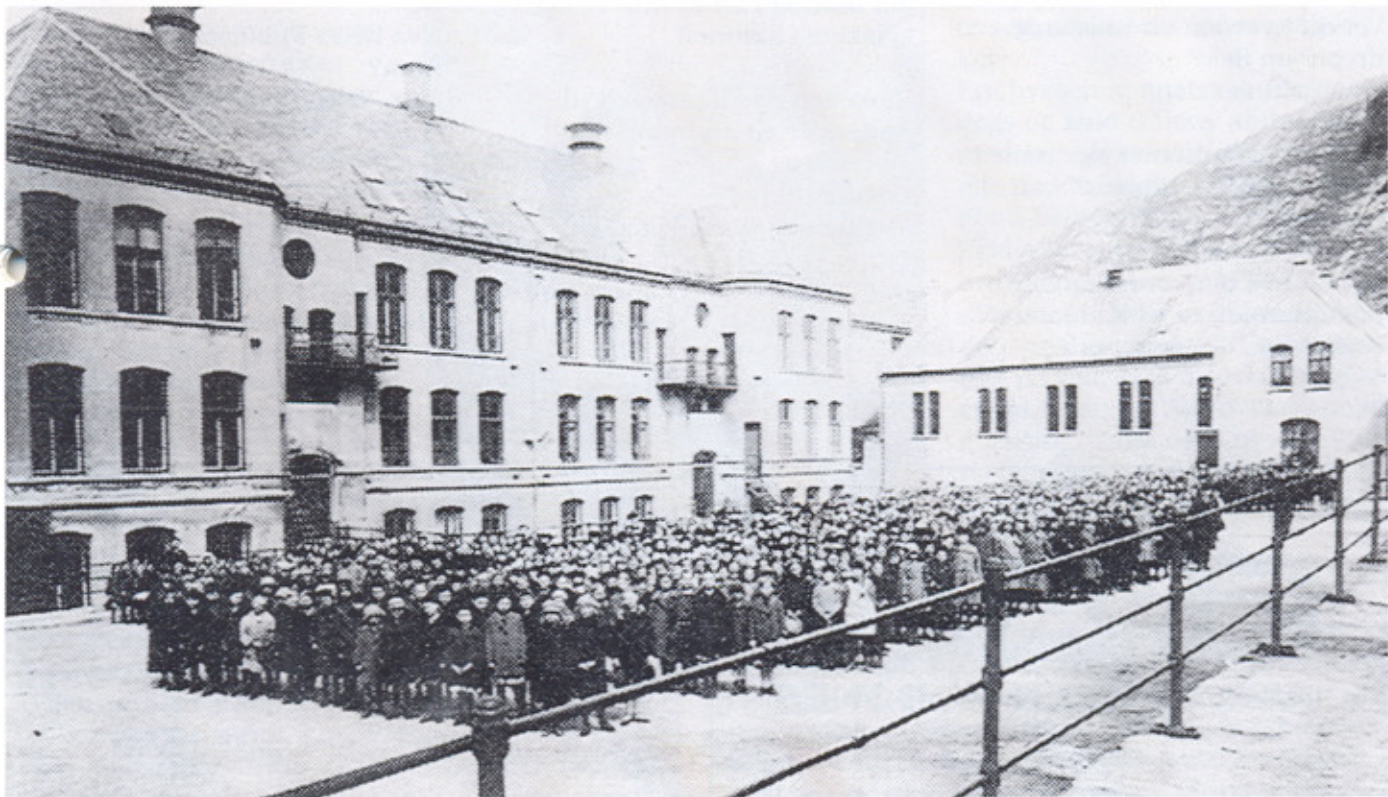
Skolebarn ved Sandviken skole, ca. 1920-årene.

Brakkene på Wilhelmineborg er borte. Den grå, triste og håpløse fattigdom er øg borte. Sandviken skole fins ikke mer. Mange vil kunne peke på – og gjør det – at elendigheten i samfunnet er stor i dag også. Det kan de ha rett i. Likevel – den er av en annen art. Både fattigdom og velstand kan ha uheldige virkninger i et samfunn.