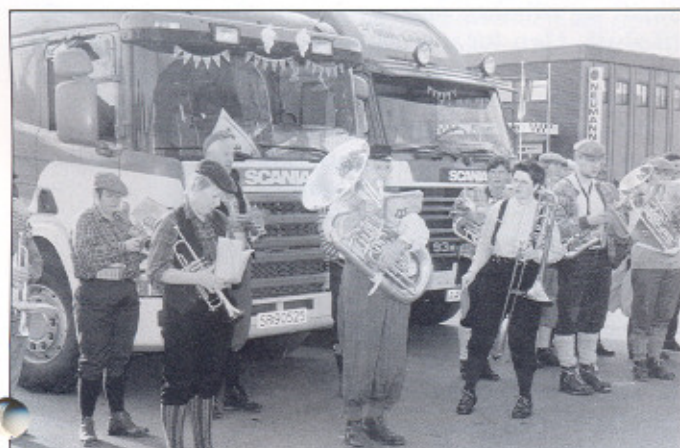
Takk til Knickersgjengen, SUK!