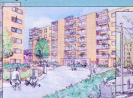
Hus B - sett fra syd-vest.