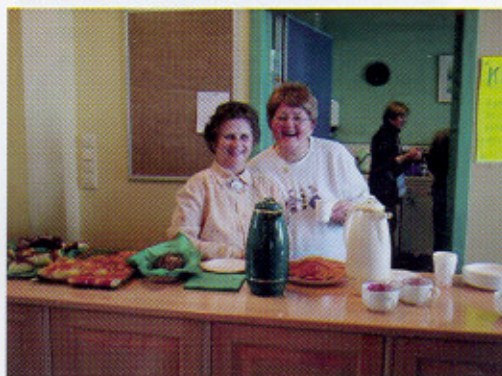
Damegardens blide fjes sørget for mat og drikke til både besøkende og til dugnads-gjengen.