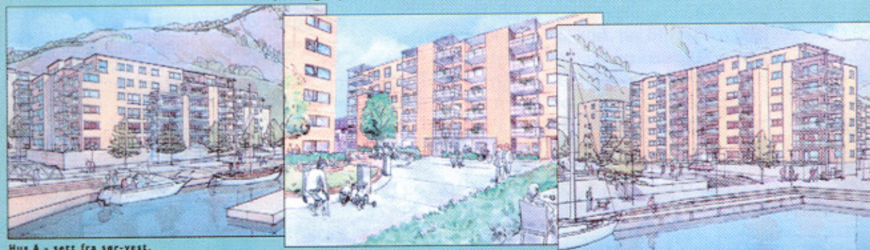
Hus A - sett fra sør-vest.

— mellom sjø og fjell, med kort avstand til byens sentrum