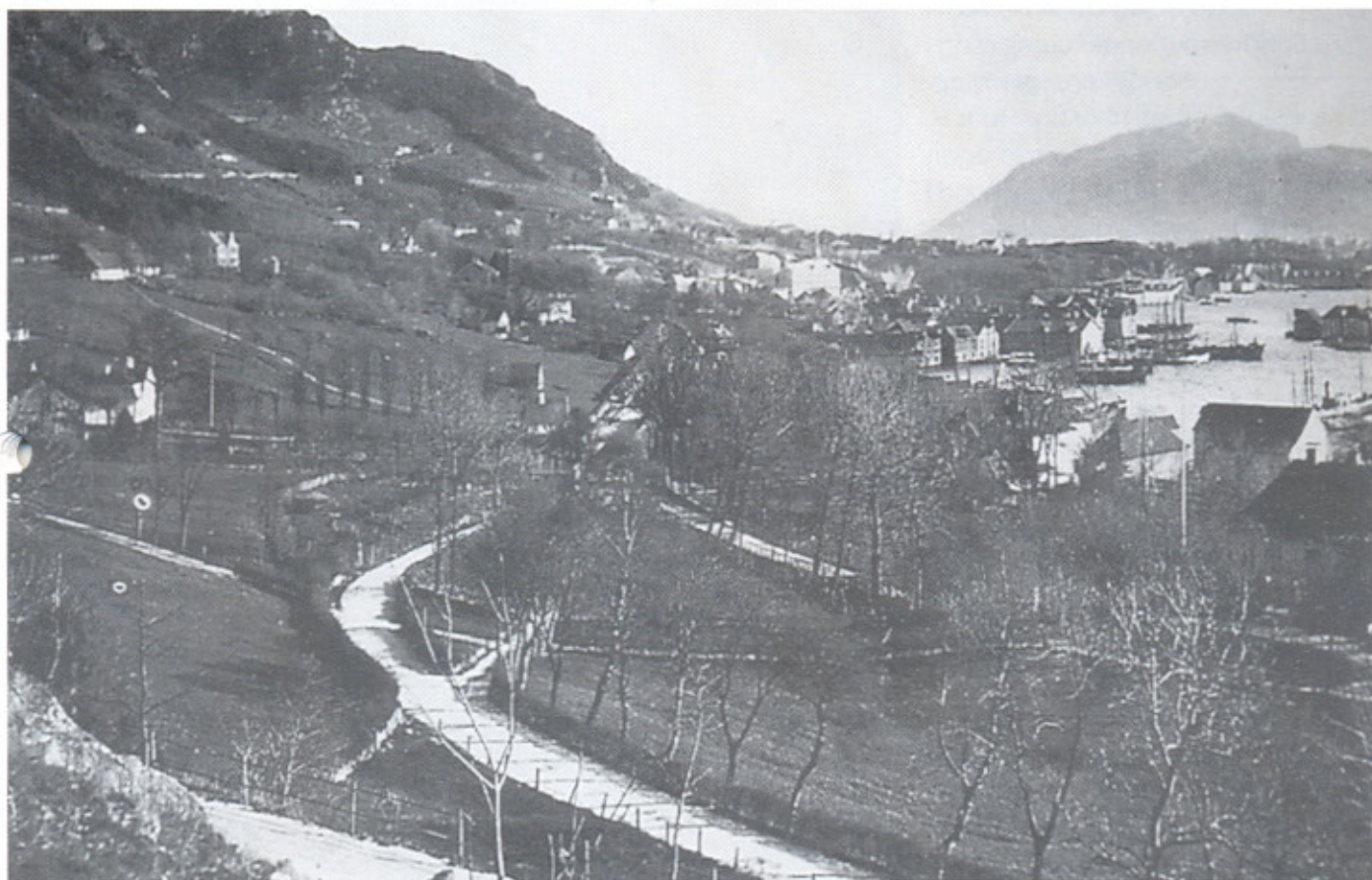
Det var her, i krysset med de tre veiene, det store slaget mellom Sandviksguttene og Dræggeguttene sto i 1861. I følge Sandvikshistorien hadde de brave Sandviksguttene ingen problemer med å avvæpne Dræggen Buekorps og tjærebre både fanen og fanebæreren deres. En stor seier for Sandvikens, et usselt nederlag for Dræggen. Dræggehistorien har selvfølgelig en helt annen versjon.

Jeg vet ikke om de bergenske bataljoner har innført feltkappelan. Jeg synes at om ikke, så burde de gjøre det. Etter at guttene stod under det første «giv akt» kunne feltkappelanen stå frem og la guttene synges et vers, deretter kunne man under kapellans ledelse enten fremsi Fadervår unisont eller kappelanen kunne fremsi en bønn som var godkjent av befalet eller styret. Der ville hermed komme inn det kristelig – folkelige preg over bataljonen som er særpreget hos oss som folk. Tenk om Sandvikens Bataljon på sitt 90 årsjubileum kunne møte frem med en feltkappelan. Man ville sikkert finne en mann med en innstilling så han kunne utfylle dette verv.»