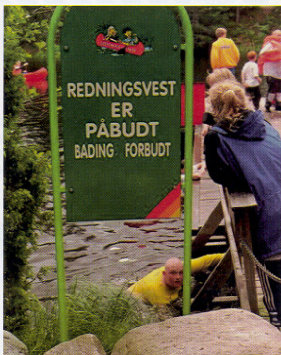
Hvem er det som bader uten redningsvest?