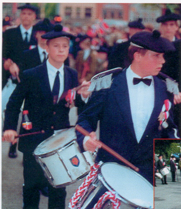
17. mai. Slagergjengen gjorde en god jobb!