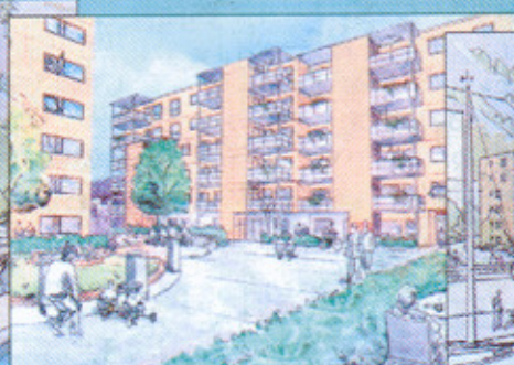
Hus B - sett fra syd-vest.