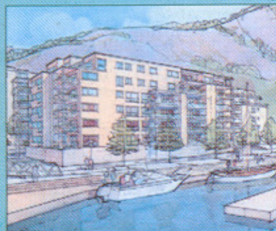
Hus A - sett fra sør-vest.

— mellom sjø og fjell, med kort avstand til byens sentrum