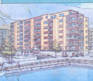
Hus C - i forkant sett fra nord-vest.