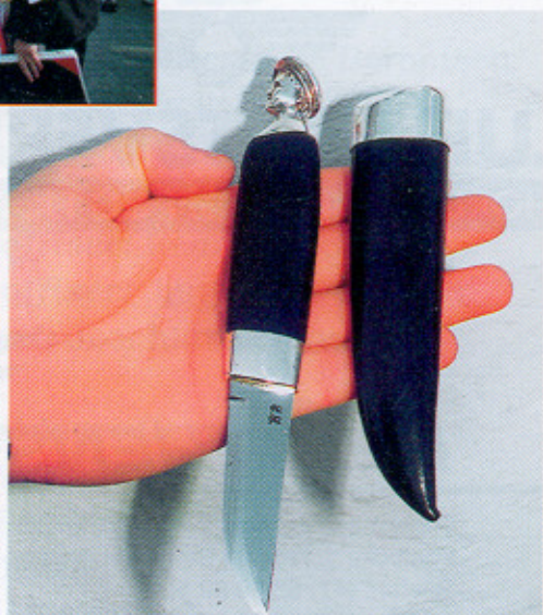
Forslag til utmerkelse i Sandviksguttene Forening, fra Terje Engevik.