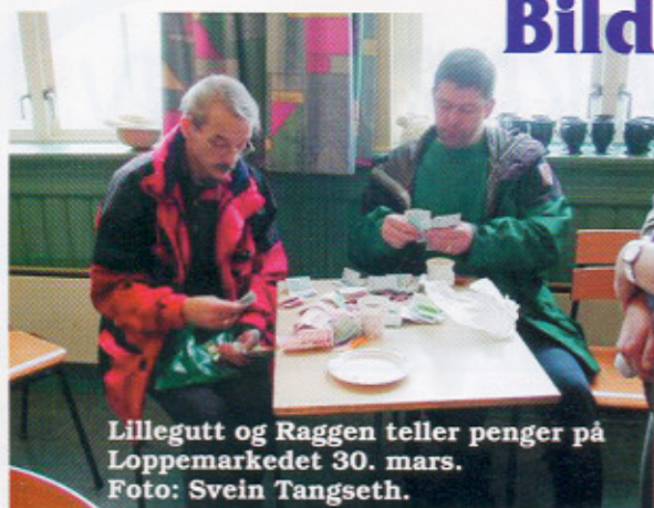
Lillegutt og Raggen teller penger på Loppemarkedet 30. mars.