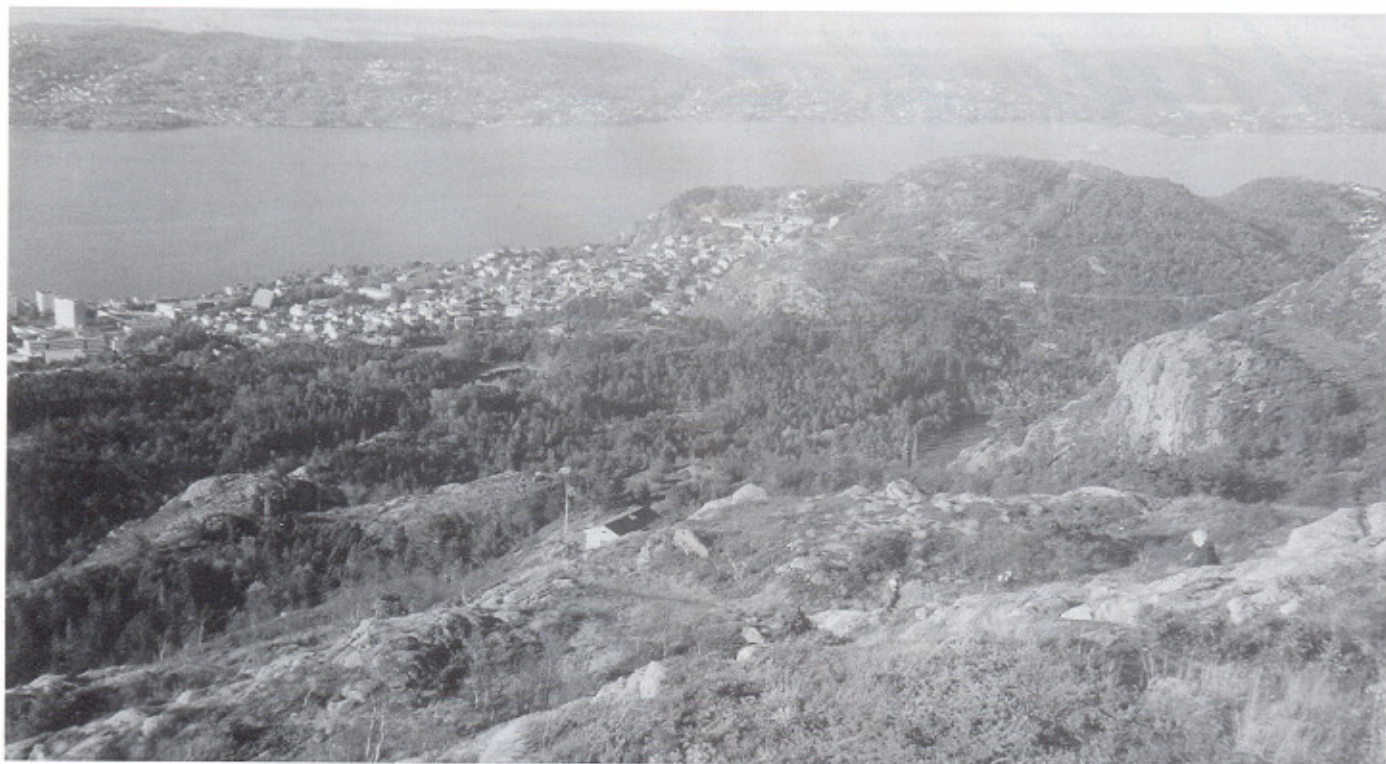
En herlig dag 14. okt. 2001. Oppstigningen fra Sandvikshytten som vi skimter midt på bildet.