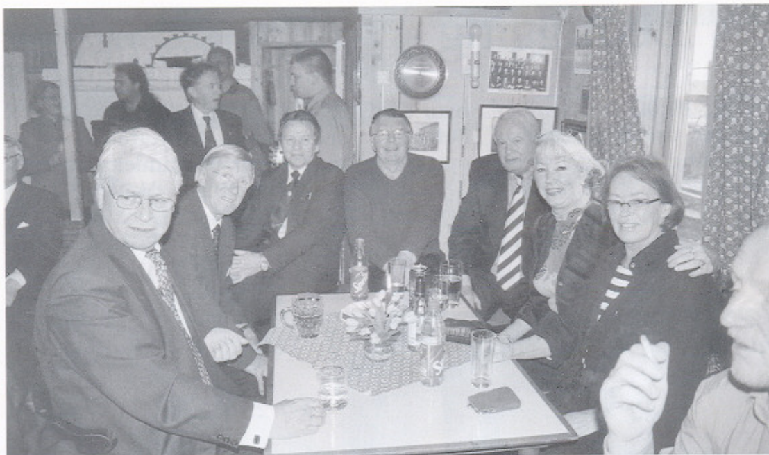
Luffen, Lingen, Maleren, Bønoen, Odden er noen av dem vi ser.