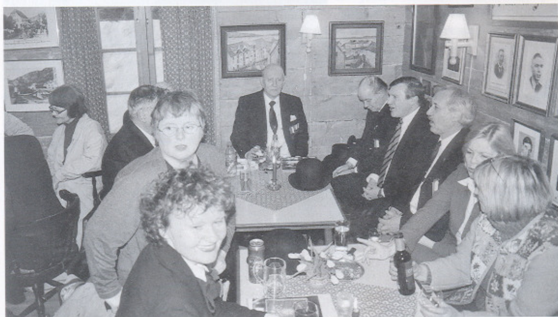
4. mai dette året (2002) var en lørdag og derfor var det mange tilstede i Huset.