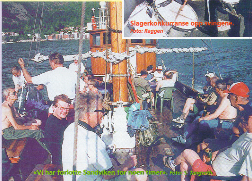
«Vi har forlotte Sandviken for noen timar».