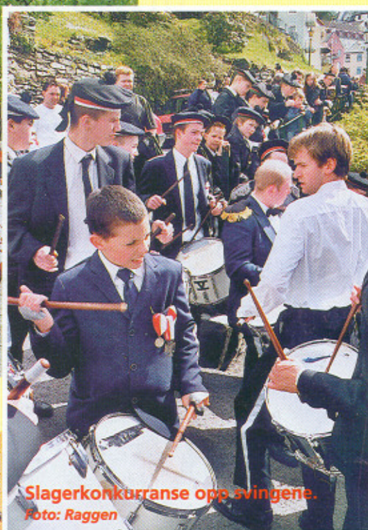
Slagerkonkurranse opp svingene.