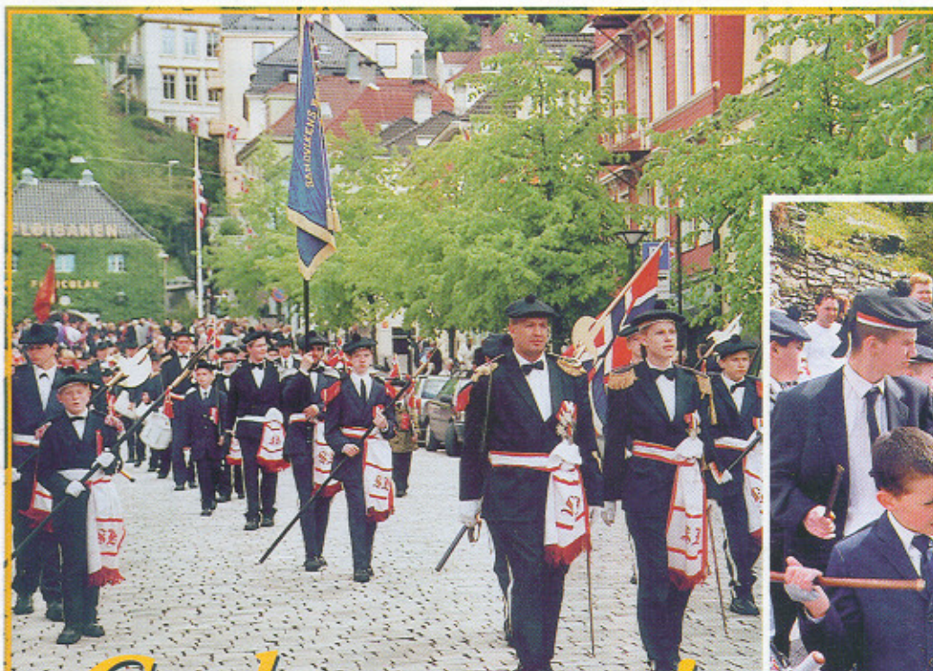
Sandvikens Bataljon marsjerer ned Vetrlidsalmenningen 17. mai 2002 på 145-årsdagen.