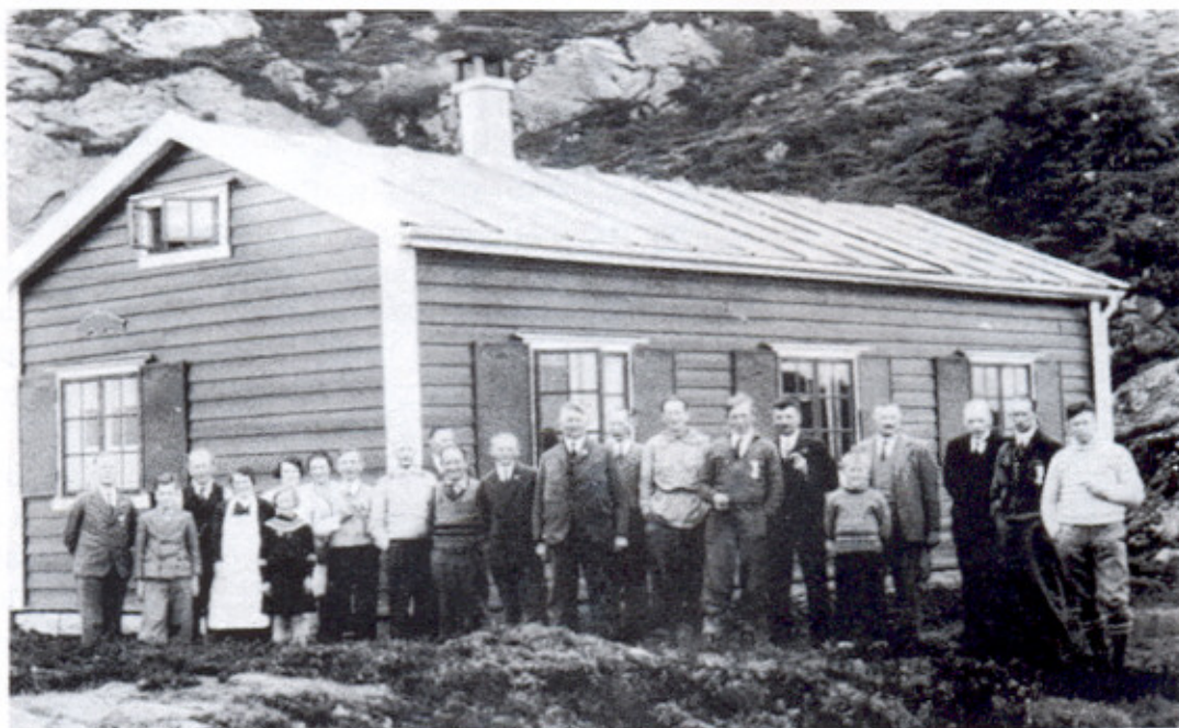
Sandvikshytten ble innviet 7. juni 1936.