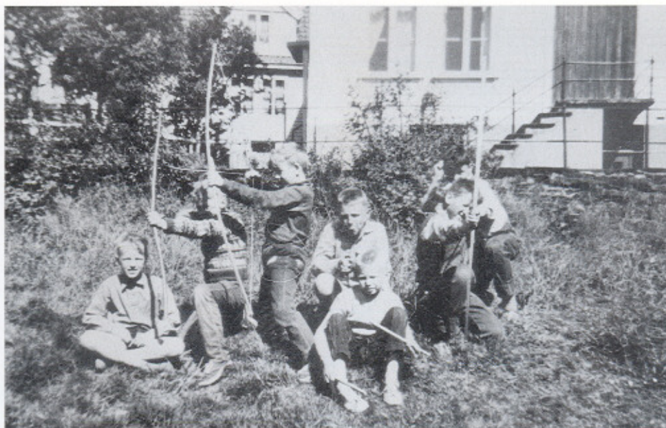
Dette bildet tok jeg av noen av guttene i gaten. Bildet er tatt muligens ca. i 1957 på Bannaen (Barnehjemsmarken). I kjelleren under trappen var jeg ulvunge med navnet Mougli.