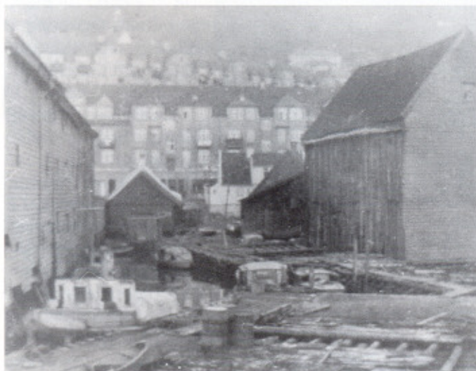
De første sjøbodene er revet og vi ser hopen som fører inn til Lahnenøstet. Lunere «båthavn» skal man lete lenge etter.

Mine 12 første år bodde jeg i Møbelsnekkernes boligbyggelag i Sandviksvei 49b, den såkalte snekkeren. Fra vinduene i 3. etg. var jeg vitne til en brutal rasering av et uerstattelig sjøbodmiljø.