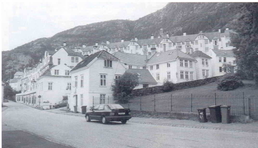
Gaten vår. T.h. Bannaen, Pyttergrenden og Snikkeren.

2. nyttårsdag 1961 satt vi kamerater som så ofte på isbaren i Ekrengaten da vi hørte at de rykket ut fra brannstasjonen. Vi fulgte sirenene, og nede i Gørbitzgangen fikk Terje sjokk; brannbilene var stoppet utenfor huset hvor han bodde. Det så nesten ut som det kom røyk ut av nr. 38a hvor familien Engevik bodde. Da vi andpusten kom nærmere, var