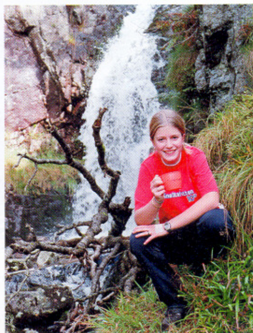
Friskt vann fra Muleelven.