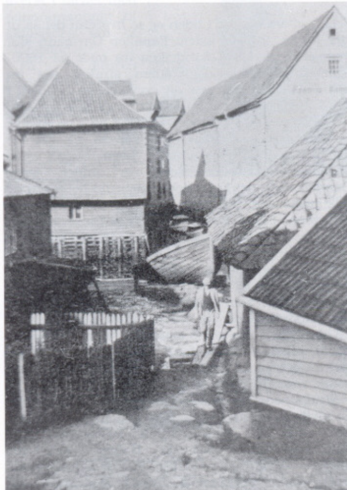
Handegaardsfjæren, da idyllen enda rådet. T.h. Mads «med steinen» sitt hus og utenfor Lahnenøstet.