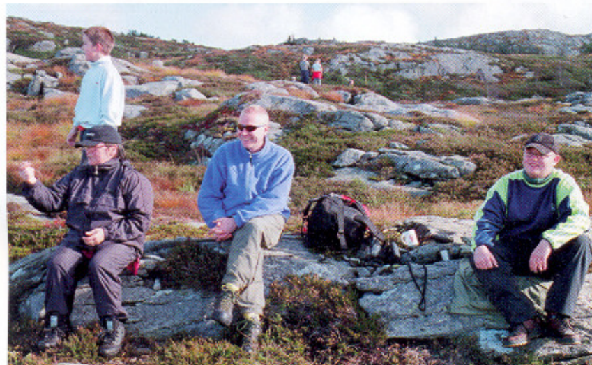
Vaktposter på Kvitebjørnen.