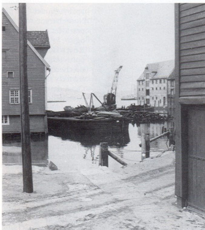
Sandvikstorget ca. i 1950-årene. Sjøbodene rives og utfyllingen er startet. T.v. Smith & Zoon som fikk stå enda noen år og t.h. ser vi hjørnet av den boden som i dag huser Rimi på Sandvikstorget.