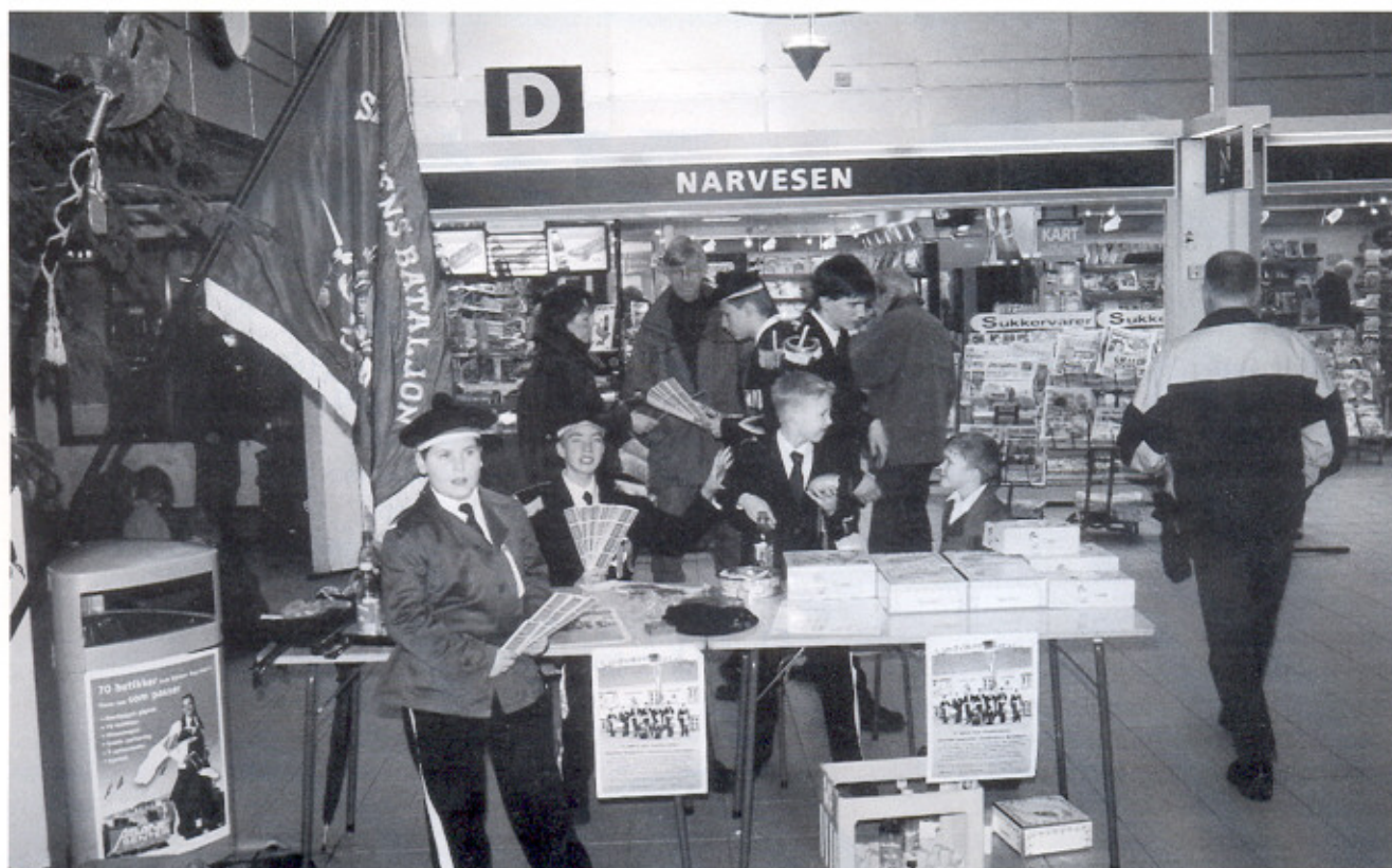
Ivrigt loddselgere: Foto: Tore Waage.