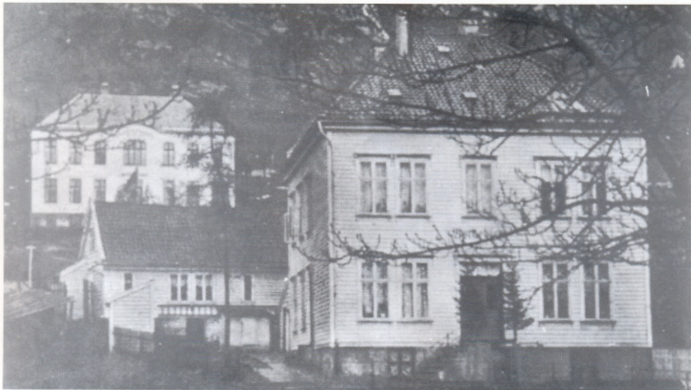
Til høyre: Barnehjem nr. 1 og i bakgrunnen Barnehjem nr. 2 som var tegnet av Schak Bull og sto ferdig i 1904.