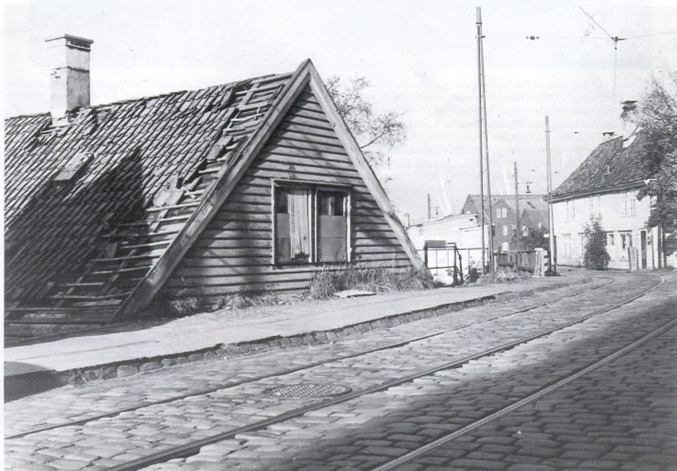
«Mads med steinen» sitt hus i sterkt forfall, ubebodd og ribbet for verdier. T.h. Sandviksvei 55, med sin egen historie. Bildet er tatt en tidlig formiddag i 1954 av Knut Omdal.