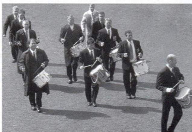
Gamlekarer fra SSS alliansen marsjerer på Mulebanen under Fellesoppvisningen 10. mai 2003.

Vi i Sandviken begynte festen med et vorspiel på Wesselstuen, og etter hvert som det ene kjente ansiktet etter det andre (og som vi gjerne ikke hadde sett på flere år) dukket opp, steg stemningen i takt. Etter en times tid hørte vi trommehvirvler. Det viste seg å være Sydnesguttene som marsjerte mot