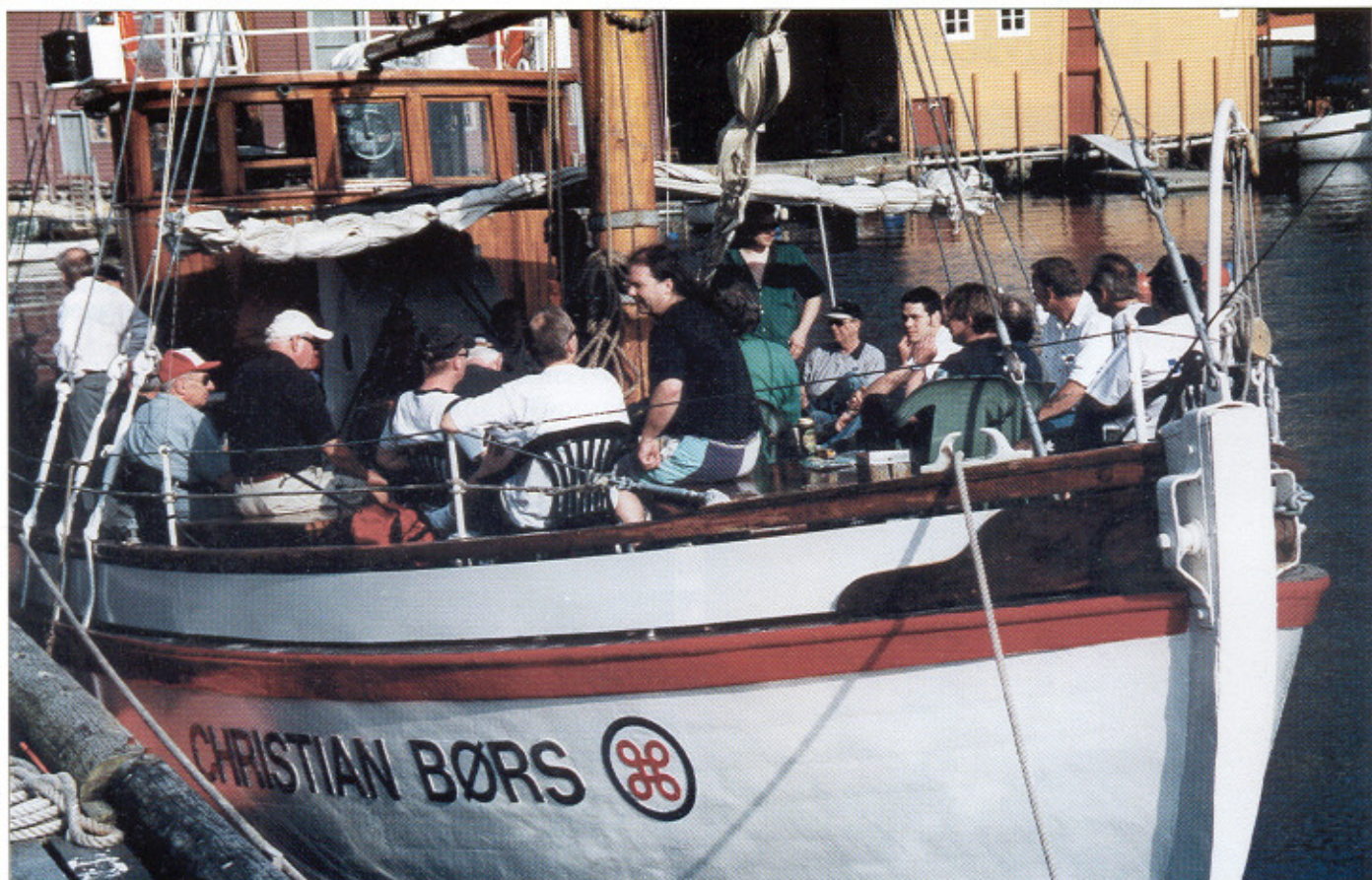
Forventningsfulle fiskere – klare til å kaste loss.