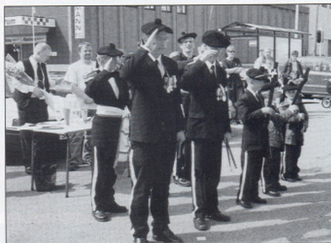
Korpsets beste i løp får sine medaljer!