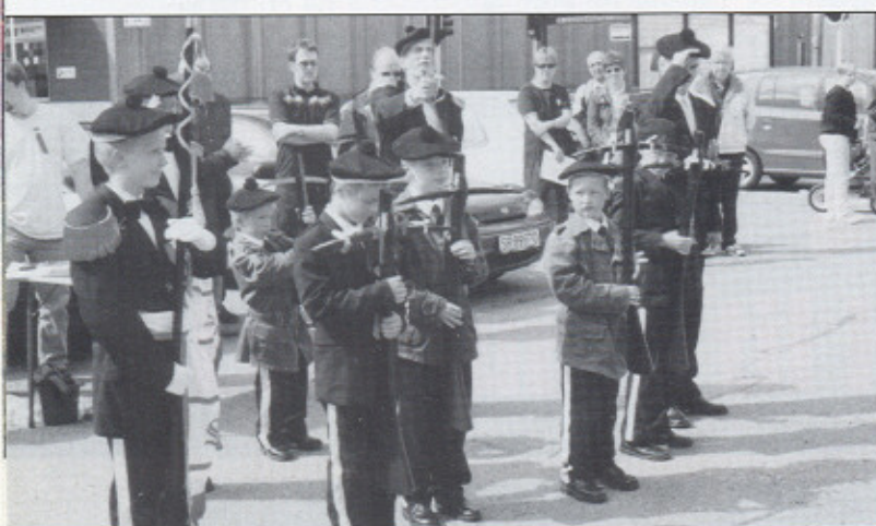
Guttene har mottatt sine 5 års ordener!