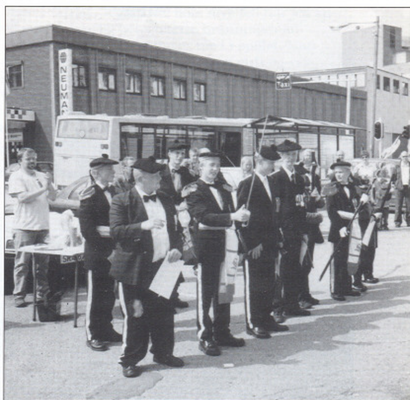
Her er en glad gjeng med skyttere som har fått sine plaketter.