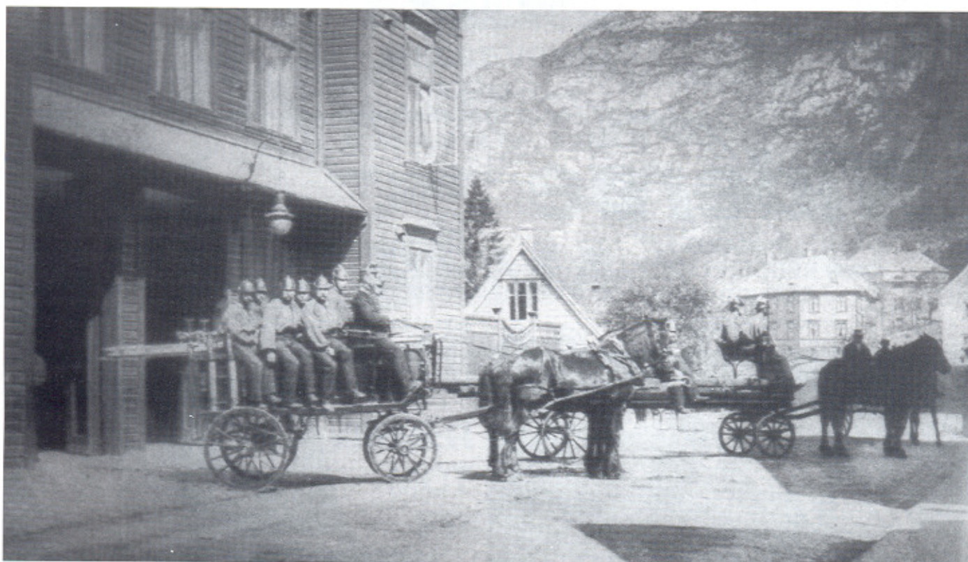
Fra stasjonens første tid. Her ser vi brannvognene klar til å rykke ut med sterke trofaste hester foran og staute brannmenn på stigevognen.

Vi er glade for at bydelen har sin egen oppegående brannstasjon. Det er en trygghet å ha hjelpen så nær dersom branner og ulykker skulle oppstå. Denne særpregede og sjarmerende brannstasjonen har vært i kontinuerlig beredskap gjennom hundrede begivenhetsrike år. Vi får håpe at Sandviken brannstasjon vil bestå også i fremtiden. Stasjonen er som oss i Sandviken nokke for seg sjøl. Tenk en brannstasjon i tre!