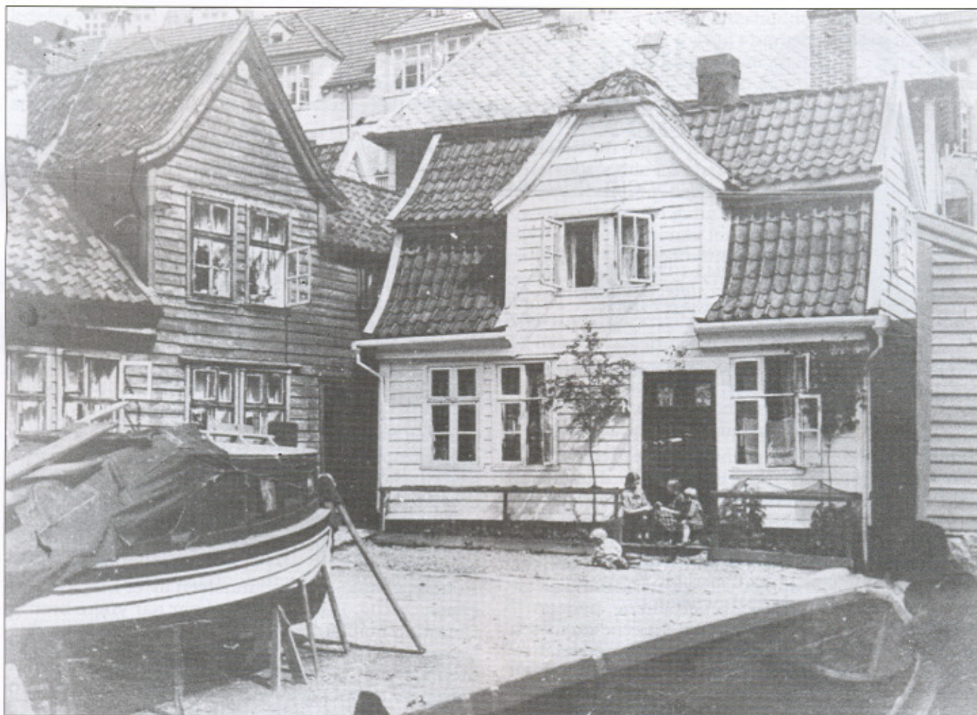
Her på Grunnen vokste bestefaren til artikkelforfatteren opp. Dette bildet er fra ca. 1925.