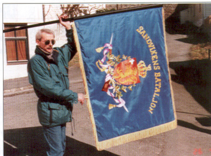
«Lillegutten» med fanen som han har brodert.