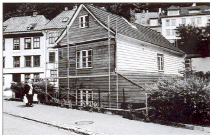
Juli 2004