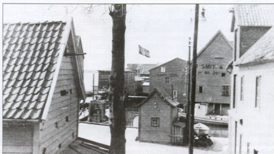
Fløttmannshuset på Sandvikstorget. Bildet er tatt under krigen.