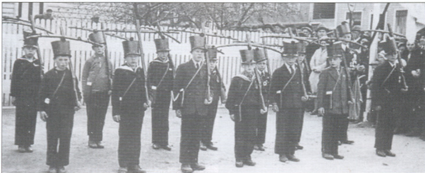
Sandvikens Buekorps, historiske optok i 1932.