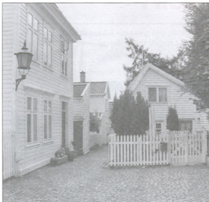
Rosemuget. I disse vakre omgivelsene marsjerte Rosemugets Kompani.