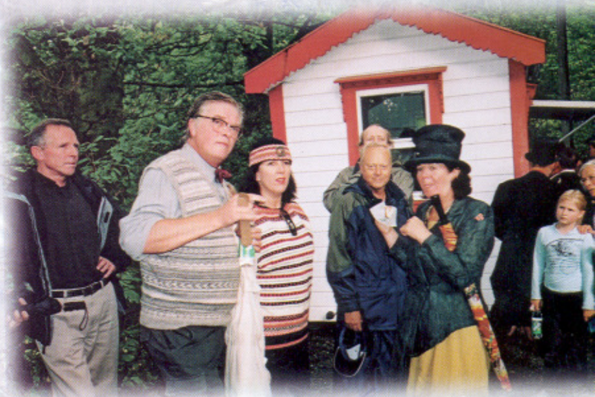
Over: Sanviken Bataljon hadde salgsbod i Fjellveien