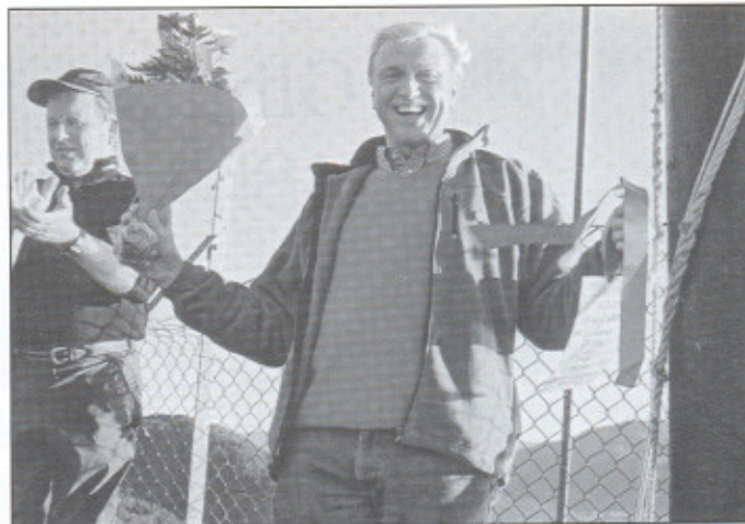
Svein bed blomstene som "Pilen" fikk.

På selve 125-årsdagen, onsdag 29. sept. 2004, mar-