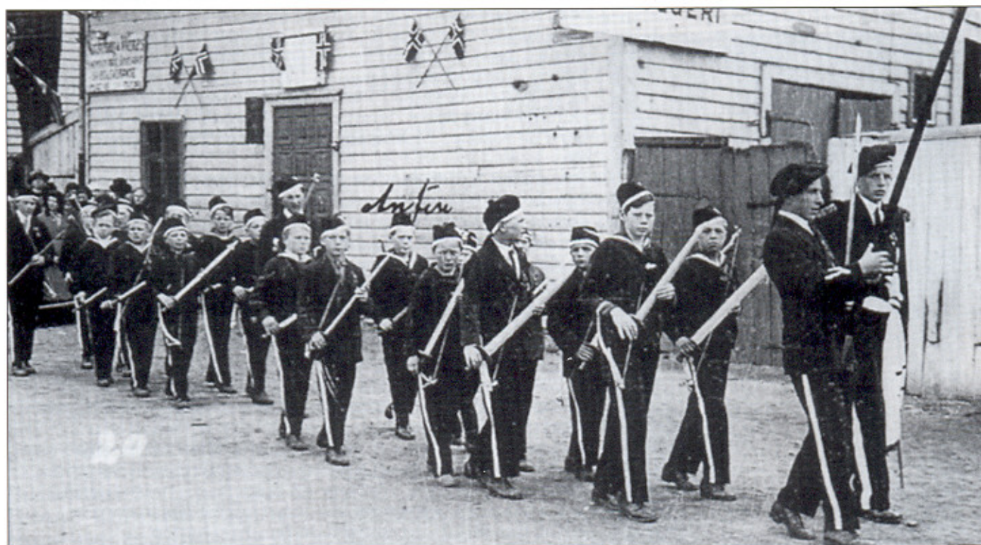
Sandvikens Kårdekorps, historiske opptog i 1932.