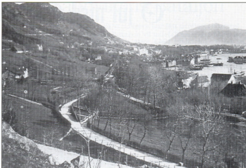
Det var her, i krysset med de tre veiene, det store slaget mellom Sandviksguttene og Dræggeguttene sto i 1861. I følge Sandvikshistorien hadde de brave Sandviksguttene ingen problemer med å avvæpne Dræggens Buekorps og tjærebre både fanen og fanebæreren deres. En stor seier for Sandvikens, et usselt nederlag for Dræggens. Dræggehistorien har selvfølgelig en helt annen versjon. Ukjent fotograf, Jo Gjerstads samling.

Da disse linier maaske agtes benyttet som et avsnit av «Sandvikens Buekorps historie» vil jeg til den knytte et ønske om, at det nu 70 aar gamle korps (dette er skrevet 1927) maa holde liv i sig til 100-aaret. Har det vundet frem saalangt, saa er visselig dets fremtid sikret ogsaa et stykke længer frem. Og jeg tviler ikke paa, at «Sandviksgutterne» vil formaa at holde det ilive og endog utvikle det. Under min deltagelse i 70-aars festlighetene ivaar fik jeg «syn for sagn» for at korpset av befolkningen ikke bare anskues som en «Guttelek». Den hele befolkning, kvinder og mænd, oldinge og barn, var paa benene. Det var rørende at se «Gamlekarene», hvorav enkelte var omkring de 70 aar, samle sig om de gamle faner og leve op igjen sin barndoms