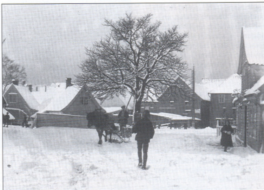
Julestemning på Sandvikstorget i mellomkrigstiden.

Vi bestemte oss for å gå på kafe i Hollendergaten, og feire handelen. Det kom en tysk soldat på sykkel og han gikk inn i kafeen før oss. På bagasjebrettet på sykkel var der montert en trekasse, og