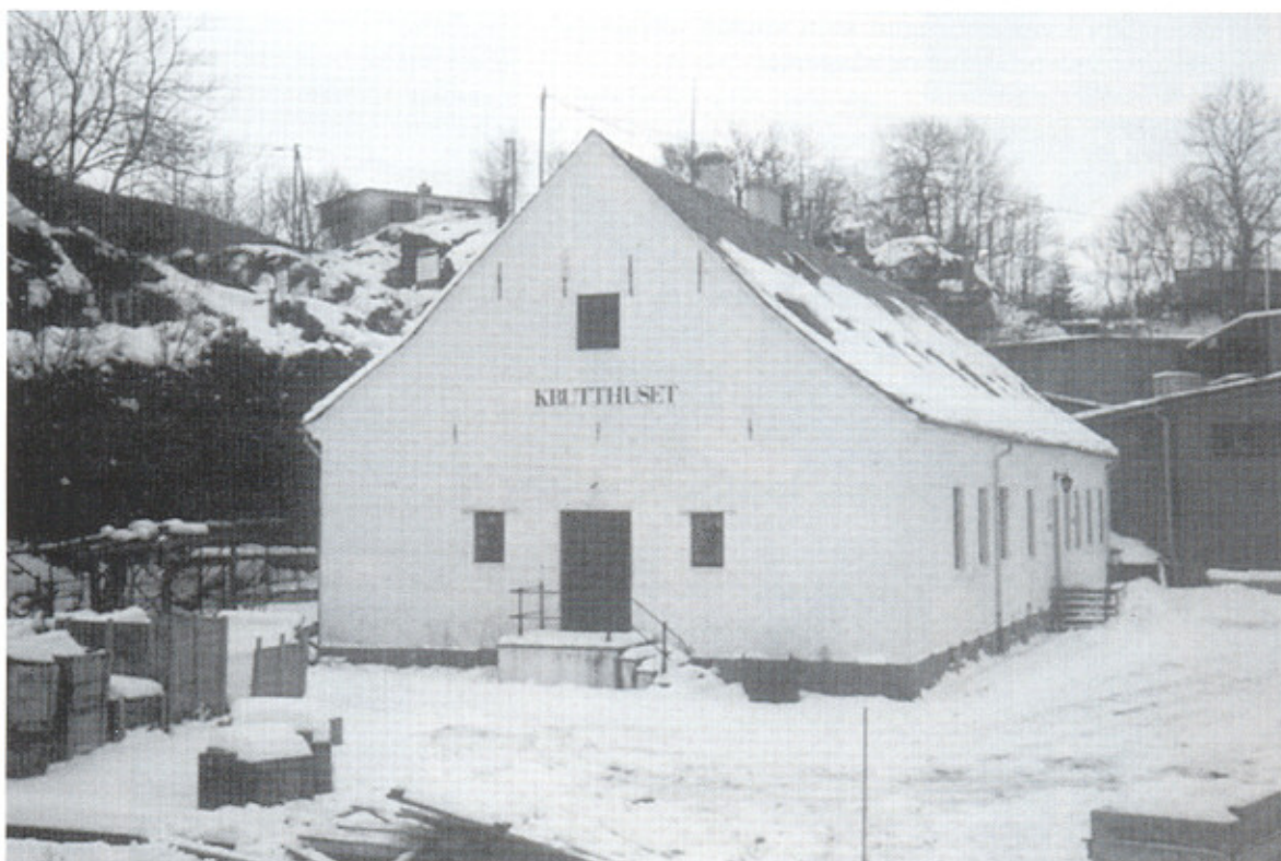
Krutthuset fra ca. 1805 ligger den dag i dag på hegrenes og minner oss om en spennende fortid.