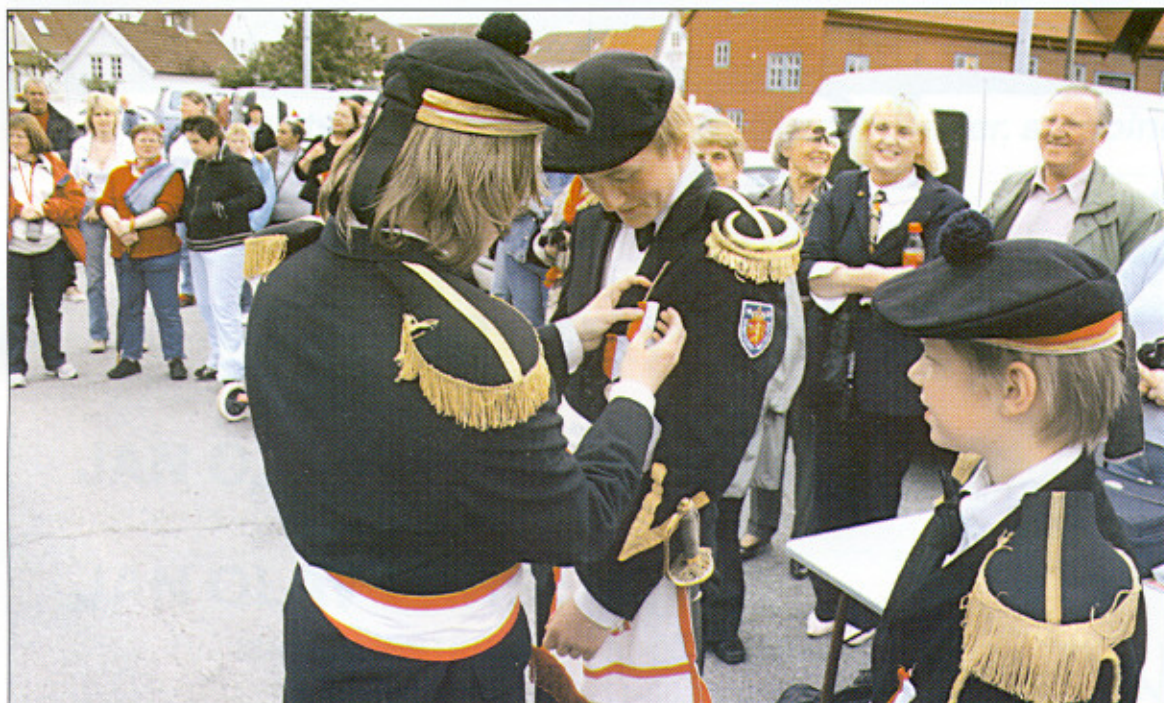
Offisersorden utdeles til sjefen av 1. komp

har stilt opp og hjulpet oss på forskjellige måter. Hjertelig takk til dere alle sammen. Jeg håper vi, også med tanke på at vi i 2007 skal feire 150 års jubileum, vil stå på og gjøre en god jobb også i sesongen som kommer, og ønsker alle lykke til med oppgavene.