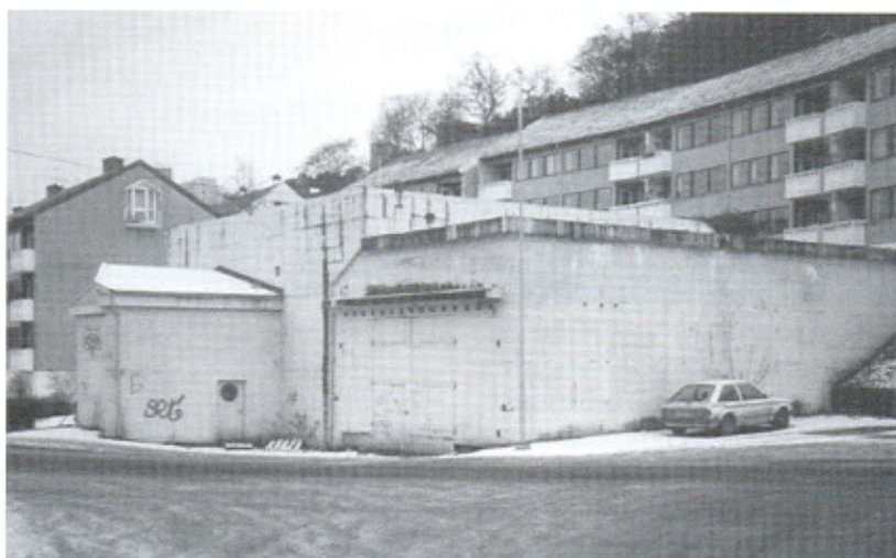
Bunkeren i Nyhavn. En av okkupasjonstidens markerte minnesmerker i bydelen.

nødvendig å ta for seg de tyske forsvarsplanene for sikring av Bergen. Byen ble omgitt av en ytre festningslinje, basert på befestninger og tyngre skyts. Artillerigruppe "Hjeltefjord", "Bergen" og "Korsfjord" skulle sikre byen mot angrep fra sjøsiden. Det var imponerende antall batterier, til sammen 21 med