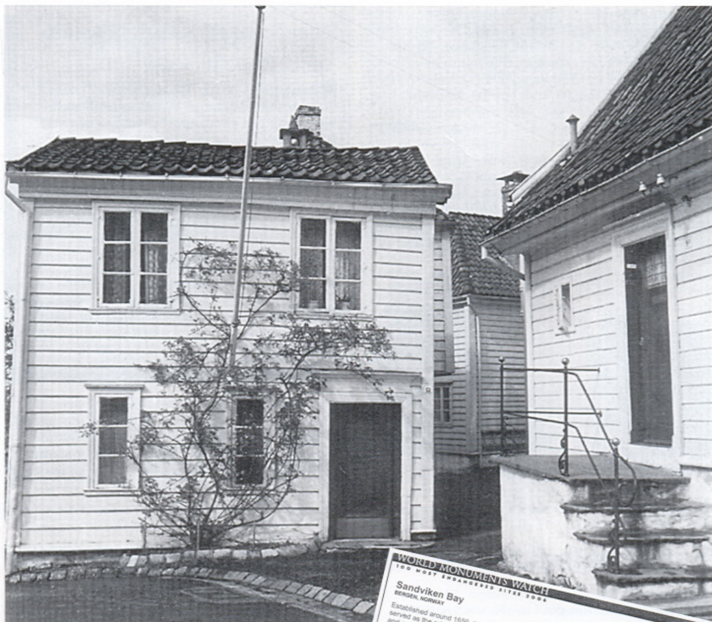
Slike idyller er det vi vil verne om. Her fra Elvegaten.

er noe av grunnen til at det har gått så langt.