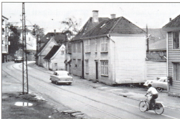
Fra Sandviksveien i 50-årene da Sandvikstrikken femdeles gikk. Husene til høyre måtte vekk da veien skulle utvides, og nye Industribygg bygges.

Tross protester ble det bygget på østre side av Sjøgaten, noe som resulterte i at Grunnen med sin hyggelige atmosfære ble stengt inne. Beboerne som før i tiden kunne trekke båtene så å si opp i hagen ble nå ute-stengt fra all kontakt med sjø og ettermiddagssol.