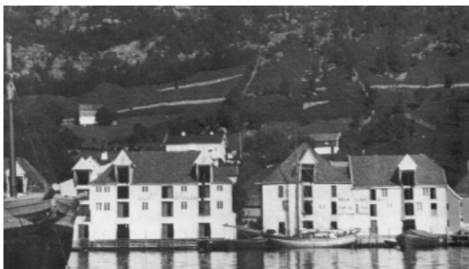
Sandviksboder nr. 68-73a, med slåttemark og enger i skråningen opp mot fjellet ca. 1900. Ytre del av Fjellveien er ennå ikke anlagt. Brødretomtens pakkerhus bak det midterste sjøhuset, og Nilsenbanens mesterhus helt til høyre. (Foto: ukjent)

Vi har dessverre ikke hatt anledning til å kartlegge sjøbodbebyggelsens kronologiske utviklingshistorie gjennom primærkilder som Garmannfamiliens register for festekontrakter, det offentlige panteregisteret og branntakstprotokollene. De siste begynner dog å løpe først i 1766-67. Det er heller ikke publisert resultater fra systematiske og uttømmende slike undersøkelser som dekker hele dette området. Det nærmeste en kommer i så måte er en ufullstendig tabellarisk oversikt over de i 1994 bevarte pakkhus i Skuteviken-Sandviken i Sandviksbukten Kulturminneområde. Del 1, utgitt av Byantikvaren. Selv her synes det klart at en del av årstallene oppgitt under rubrikken «første sikre datering» ikke er tidlige nok. Men det finnes troverdige daterings-informasjoner i andre lett tilgjengelige