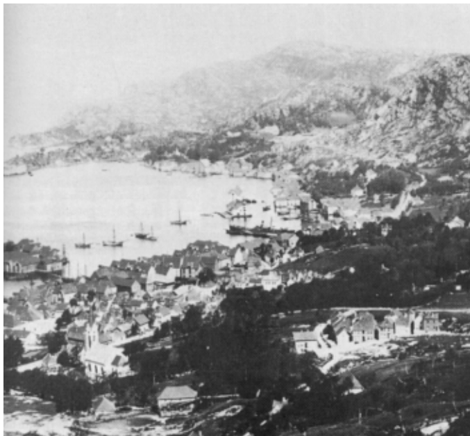
Sandviksbukten sett fra Breistølen ca 1885. Bortsett fra den lille grenden ved mulelven, Festergrenden, Pyttergrenden og de spredte lyststedene er det lite urban bebyggelse i lien ovenfor Sandviksveien.