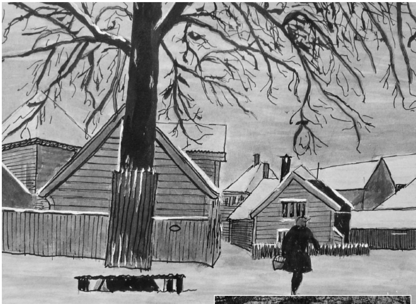
Treet ved Sanvikstorget