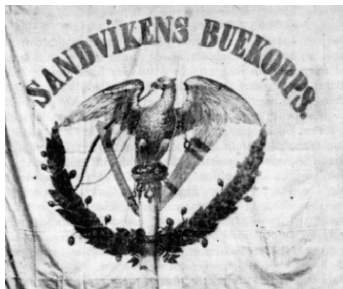
Eldste fans i korpsets eie – ØRNEFANEN