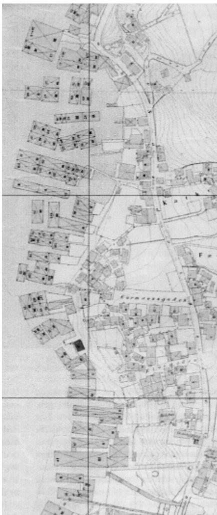
Utsnitt av generalkartet 1879-81, indre del av Sandviksbukten. Stoltzeneset med veien opp til Frydenlund lengst oppe, (i nord)