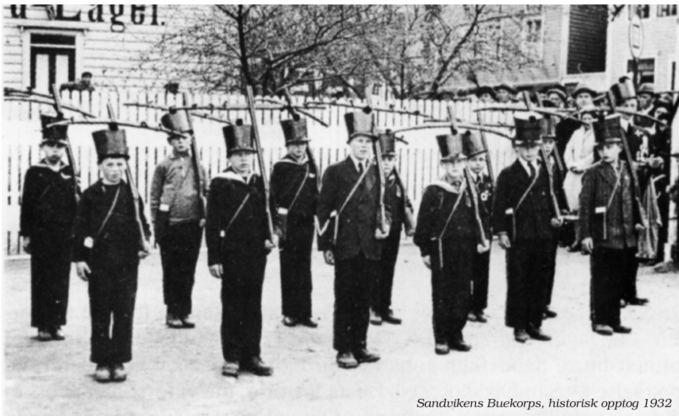
Sandvikens Buekorps, historisk opptog 1932